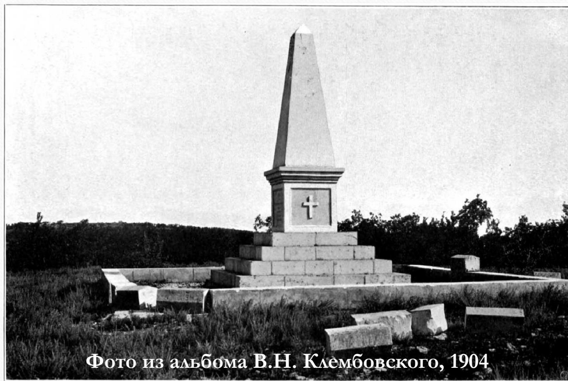
Фото из альбома В.Н. Клембовского, 1904