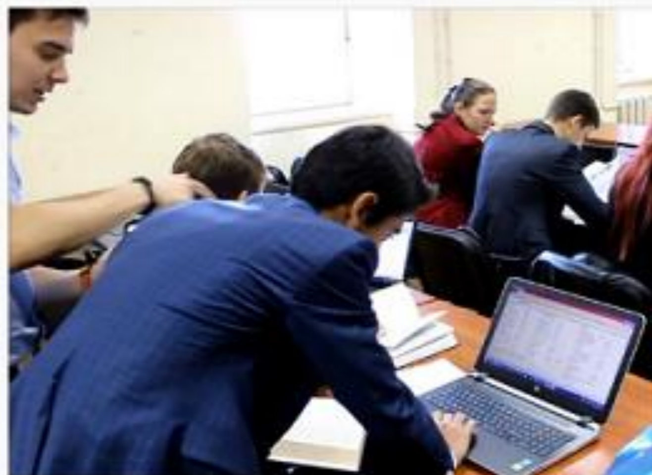
Global Management Challenge