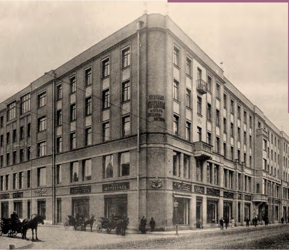
Мясницкая, 24 в 1907 году