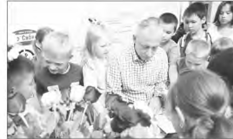
Зрителями программы «Северного десанта-2022» были и взрослые, и дети