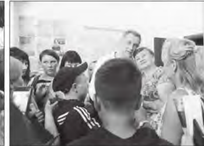
Чтобы сфотографироваться с актерами качугцы выстраивались в очередь