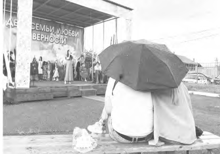
И в дождь, и в снег будьте с любимыми, будьте любимы. 8 июля 2022 год, п. Качуг

В Качуге на концерте, посвященном Дню семьи любви и верности, чествовали семейные пары и династии