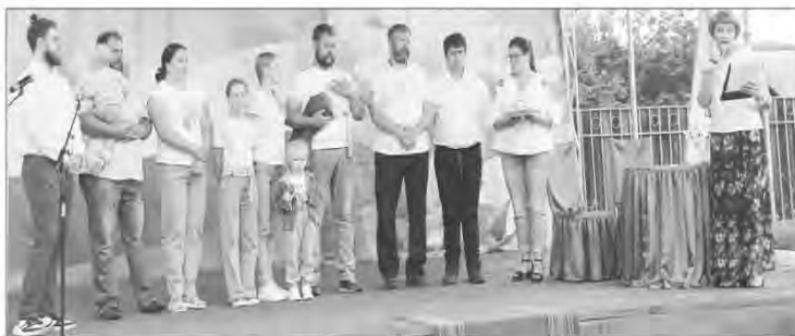
Вера в общее дело — рецепт счастья аграрной династии Хмелевых