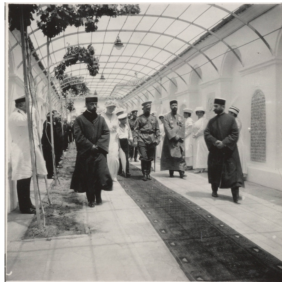
Николай 2 посещает краимские кенасы в 1916 г.