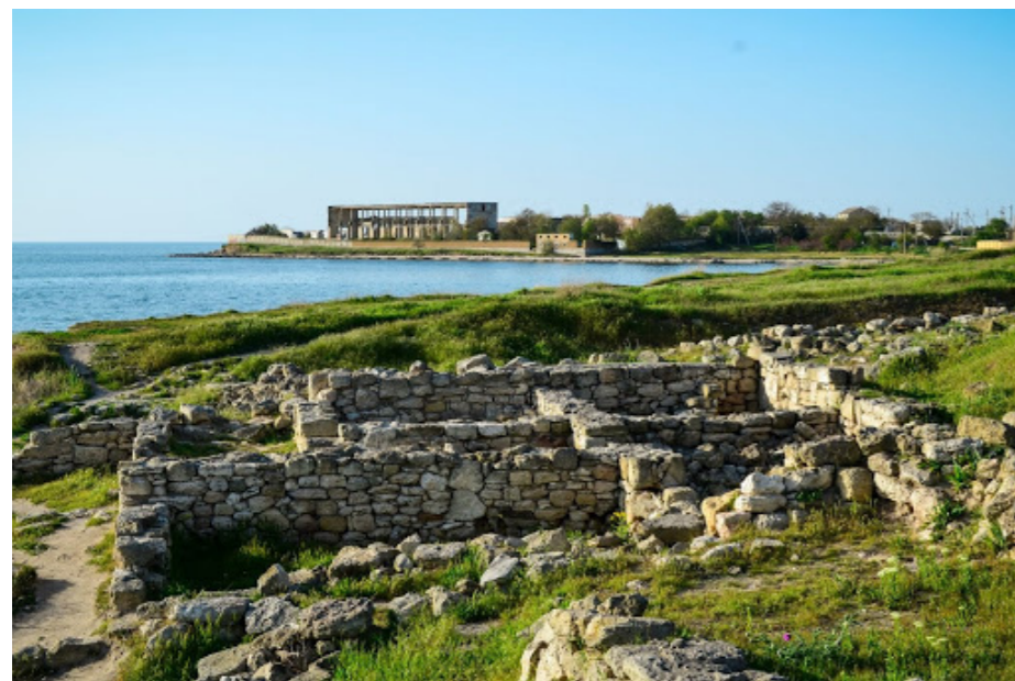
Калос Лимен – историческая достопримечательность п. Черноморское

Остатки древнегреческой колонии хранятся под стеклянным куполом в Евпатории на Дувановской улице, на набережной Горького и в городском краеведческом музее. Здесь туристы и жители города могут увидеть основы жилых домов Керкинитиды и предметы быта древних греков.