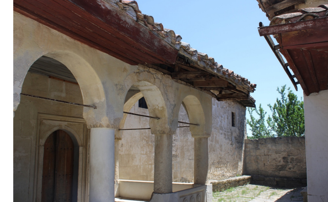
Улица пещерного города

После того, как караимы начали расселение по территории Российской империи, именно в Евпатории образовалась самая влиятельная община, и в 1837 году город был законодательно определен духовным центром караимов России. Караимские кенасы – это не только известный этап туристического маршрута «Малый Иерусалим», но и действующий культурный центр этого народа. В настоящее время в нем проводятся экскурсии, работает караимская библиотека «Карай-битиклиги», а также размещены небольшой музей и кафе караимской кухни под названием «Караман». Комплекс состоит из зданий Большой и Малой кенас (молитвенных домов, аналогичных синагогам), нескольких дворишков и начальной школы для мальчиков (мидраш). Проходя по первому коридору, сплошь увитому виноградной лозой, в глубине вы увидите каменный обелиск в честь посещения кенас императором Александром I. В одной из ниш – фонтан. Следующий дворик замощен мраморными плитами, за ним дворик ожидания со скамьями, где находятся входы в кенасы. Завершает ансамбль небольшой садик с металлической беседкой. Это место действительно уникально, оно пропитано древними обычаями, красотой и верой.