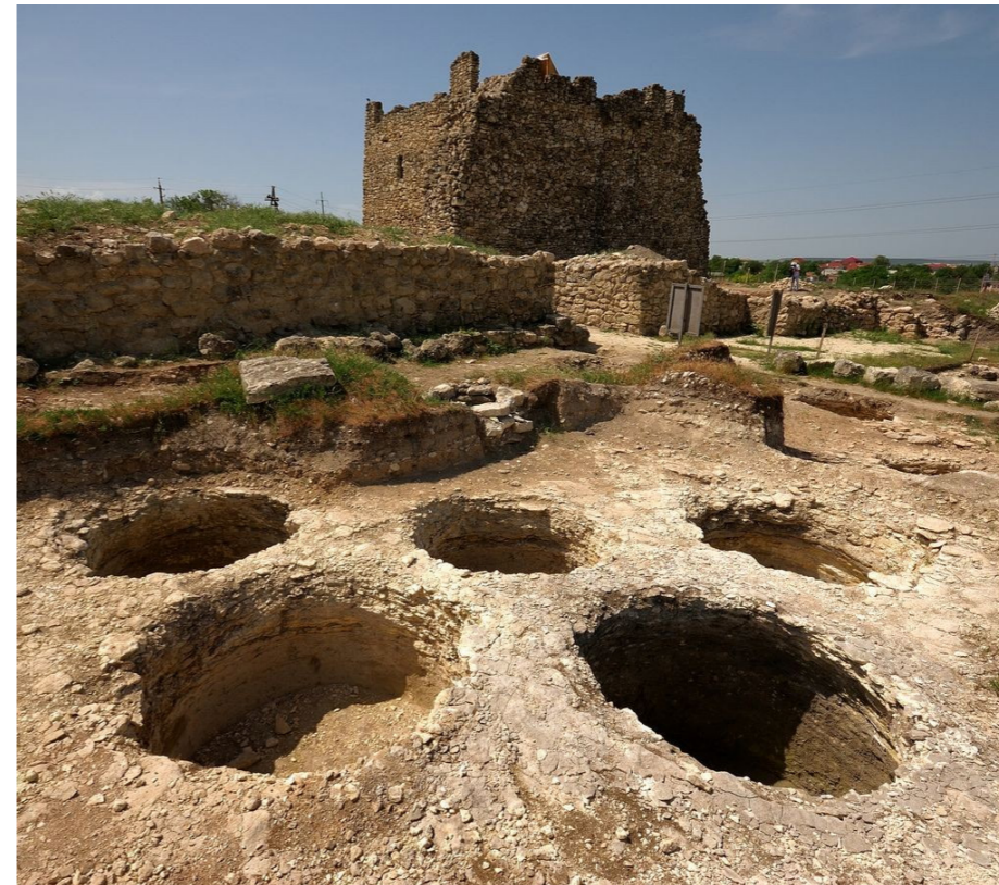
Харакс – крепость и дворец в Гаспре

Сегодня на месте античного города находится исторический памятник, возле которого можно увидеть руины древнегреческой крепости, остатки центральных ворот города и плиты главной улицы.