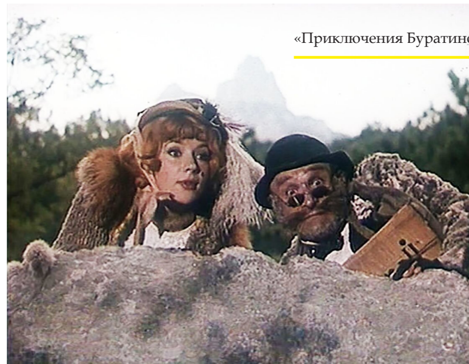
«Приключения Буратино», 1975 год. Севастополь, Херсонес

Ялту невозможно забыть или не полюбить с первого взгляда. Этот город с просторной набережной, тихими и узкими улочками напоминает Францию. Именно этим сходством воспользовался режиссер фильма Леонид Квинихидзе. Многие эпизоды были сняты на улицах Дражинского и Свердлова. А пансион благородных девиц – это Воронцовский дворец в Алушке.