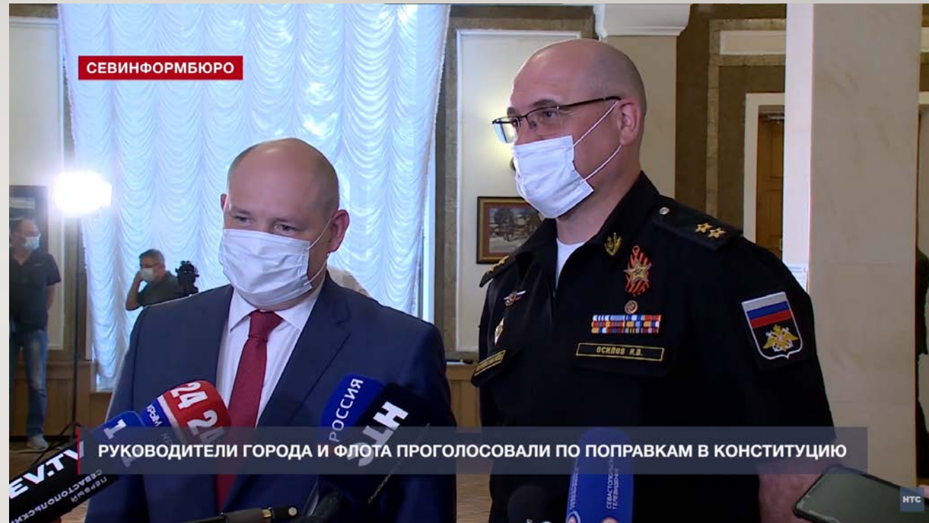
Михаил Развожаев принял участие в голосовании по поправкам в Конституцию