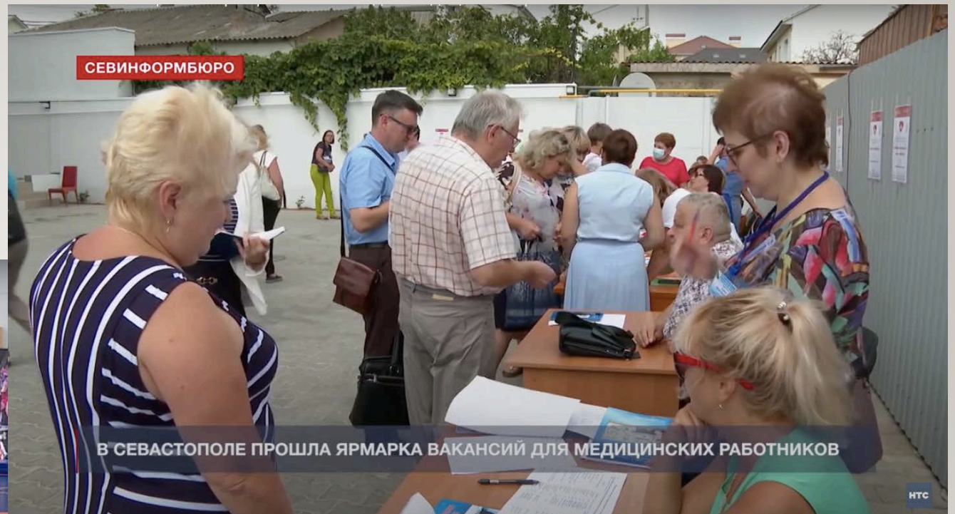
Ярмарка медицинских вакансий