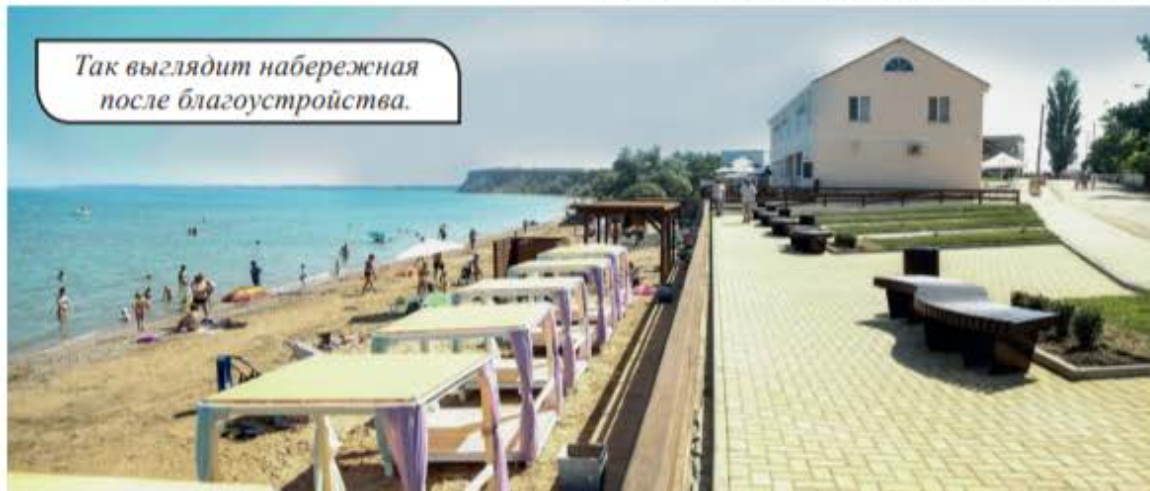
Так выглядит набережная после благоустройства.

Реализация такого благоустройства способствовала появлению востребованной общественной территории в муниципальном образовании, позволила сохранить уникальный для данного муниципального образования объект – выход к морю и такую набережную, которой