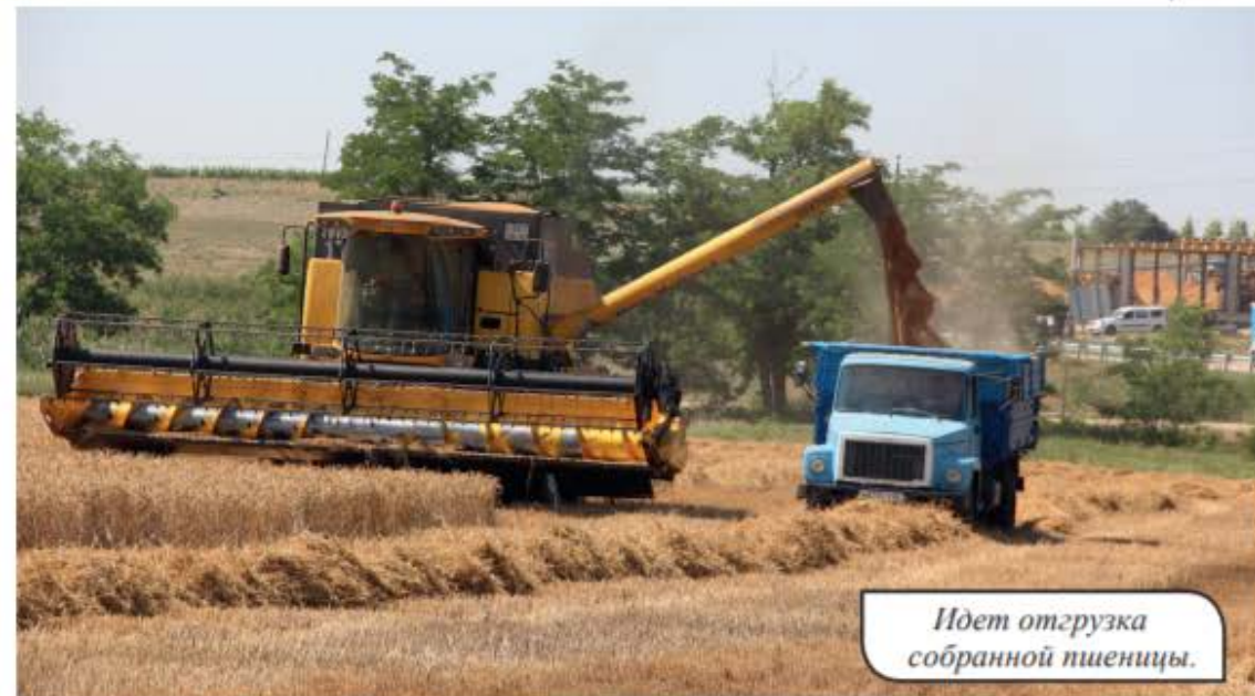
Идет отгрузка собранной пшеницы.

В Бахчисарайском районе начался сбор урожая зерновых. Работники сельского хозяйства трудятся не покладая рук. И хоть урожаи не такие обильные, как в прошлом году, их старания не напрасны. В селе Угловое на полях агрофирмы «Черноморец» посажено 419,3 гектара пшеницы. Уборка уже завершена, намолочено 1261 тонна зерна. К концу жатвы агрономы вышли на хороший показатель (учитывая минимальное количество осадков, которые выпали в этом году): 30,1 центнера с 1 гектара, учитывая, что в других регионах собирают 10 центнеров с 1 гектара.